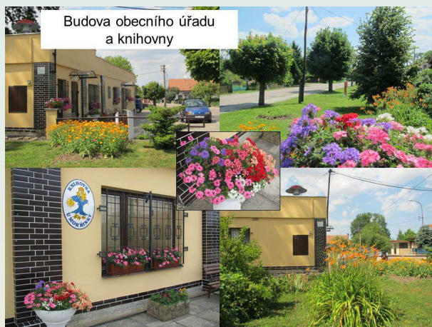
Budova obecního úřadu a knihovny

Místní knihovna Mokrý, knihovna U Mokřinky – Knihovna roku 2009 a 2014 146 obyvatel, http://www.obecmocre.cz/knihovna/