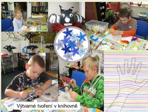
Výtvarné tvoření v knihovně