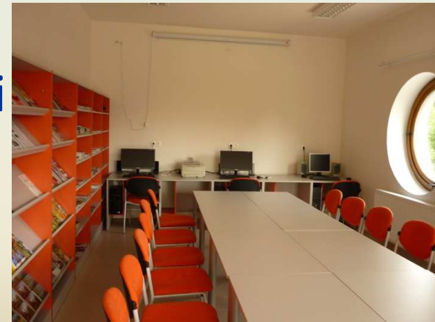
Obecní knihovna Stěžery