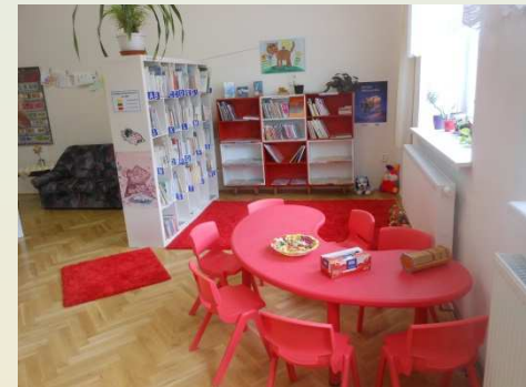
Obecní knihovna Heřmánkovice