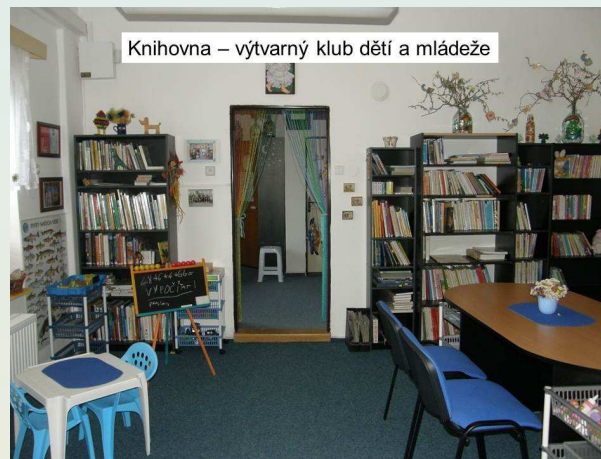
Knihovna – výtvarný klub dětí a mládeže