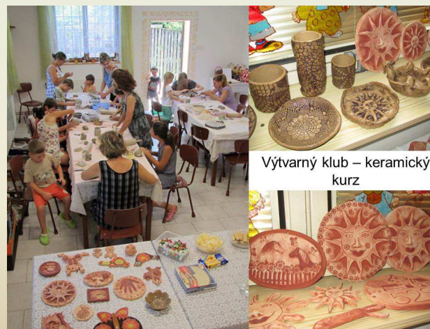
Výtvarný klub – keramický kurz