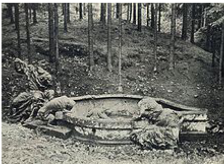
Sousoší Studny Jákobovy před restaurováním roku 1907