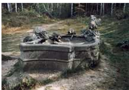
Jakobova studna (1726–29)