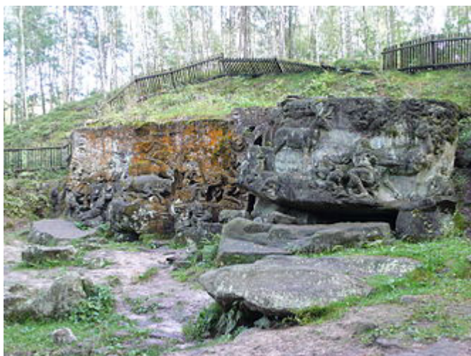
zleva: Příchod Tří králů, Klanění pastýřů, Vidění svatého Huberta

Areál Nového lesa u Kuksu (nepřesně, ale rozšířeně též Betlém) je unikátní barokní sochařsko-krajinářskou realizací, vytvořenou v letech 1718–1732 za účasti významného barokního sochaře Matyáše Bernarda Brauna a jeho dílny pro hraběte Františka Antonína Šporka jako širší součást rezidenčního a lázeňského komplexu Kuks. Nachází se v Královéhradeckém kraji mezi městy Dvůr Králové nad Labem a Jaroměř, zhruba 2 km severně od Kuksu a zhruba 1 km od Stanovic, na jejichž katastru leží. Část sochařských prací v Novém lese je řazena k nejkvalitnějším dílům českého barokního sochařství. Od roku 2002 je areál chráněn jako národní kulturní památka.