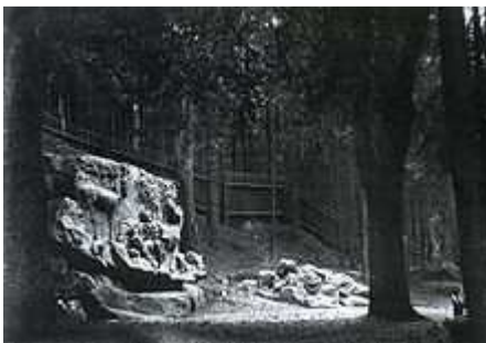
Ústřední část areálu po restaurování roku 1907

Roku 1899 byla Klubem turistů ze Dvora Králové do „Betléma“ vyznačena „dvěma proužky bílými a jedním světle modrým“ turistická značka. Kromě toho se Klub českých turistů začal angažovat v otázce ochrany a obnovy areálu.