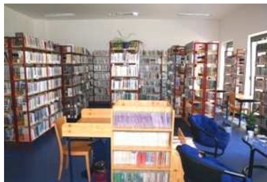
Interiér nově zrekonstruované pobočky ve Formánkově ulici

Dalším významným počinem bylo získání prostor bývalé studovny SVK HK na Eliščině nábřeží. Knihovna města Hradce Králové si část těchto prostor zadaptovala a zřídila zde půjčovnu pro děti a mládež.