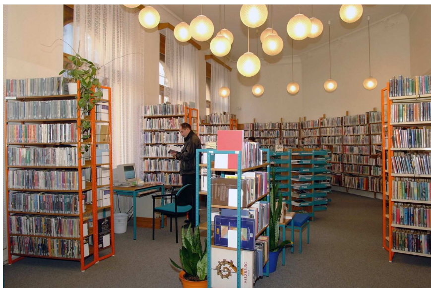
Interiér ústřední půjčovny v Tomkově ulici čp. 177

Ústřední půjčovna má od jara 2008 otevřeno pro své návštěvníky od pondělí do pátku od 9 do 18 hodin a v sobotu od 8 do 12 hodin.