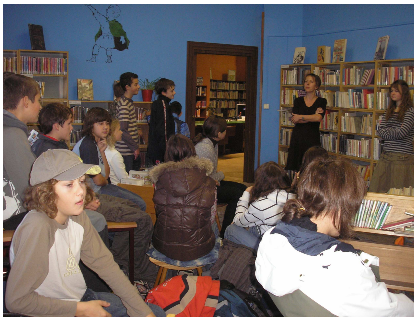
O služby nové půjčovny pro děti a mládež na Eliščině nábřeží je velký zájem

V prostorách na Eliščině nábřeží máme bohatý výběr beletrie i naučné literatury. Do volného výběru jsme zařadili kolem deseti tisíc knih. Odebíráme i patnáct titulů časopisů. Veřejnost může využívat také tři počítače s přístupem na internet. V knihovně je rovněž k dispozici počítač, který je určen pro prohlížení výukových a herních CD. Půjčovna bude sloužit všem dětem a mládeži z širokého okolí centra.