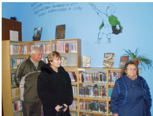
Eliščino nábřeží – dětská půjčovna KMHK exkurze 25.11.2008