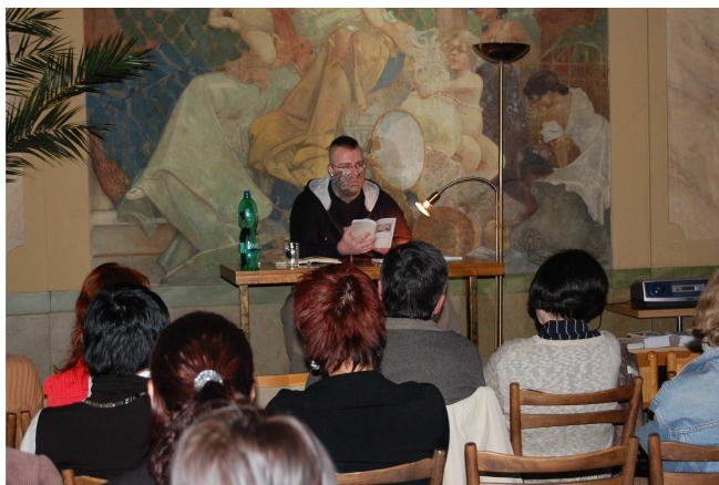
Autorské čtení kontroverzního básníka Pavla J. Hejátka v březnu 2008

V přednáškovém sále knihovny v Tomkově ulici proběhlo 28 akcí - přednášek, besed, výstav, knižních křtů a dalších kulturních a vzdělávacích pořadů - pro dospělé návštěvníky. Celkem je jich zúčastnilo 1.057 lidí.