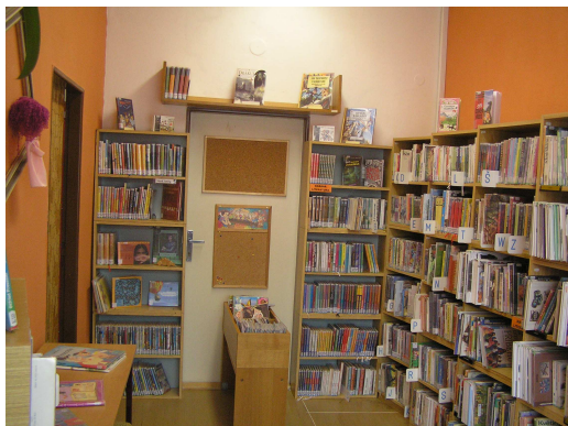
Interiér dětského oddělení pobočky Plotiště

Čtenáři pobočky v Plotištích měli od září 2008 důvod k radosti. Knihovna získala s laskavým svolením Komise místní samosprávy v Plotištích pro své potřeby (a hlavně pro potřeby svých uživatelů) další prostor, který sousedí se původní půjčovnou. Mohli jsme tedy malé prostory, ve kterých se tísnilo oddělení pro dospělé a dětské čtenáře, upravit tak, že děti i dospělí mají svá vlastní oddělení.