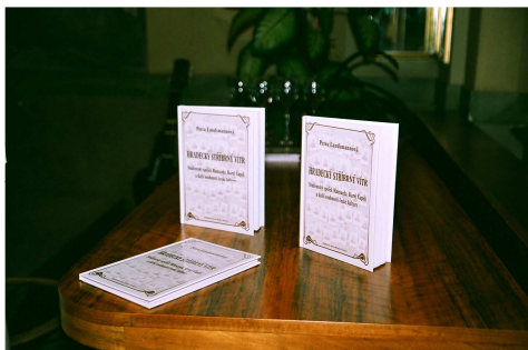
Publikace Hradecký vítr vyšla u příležitosti výročí úmrtí spisovatele K. Čapka