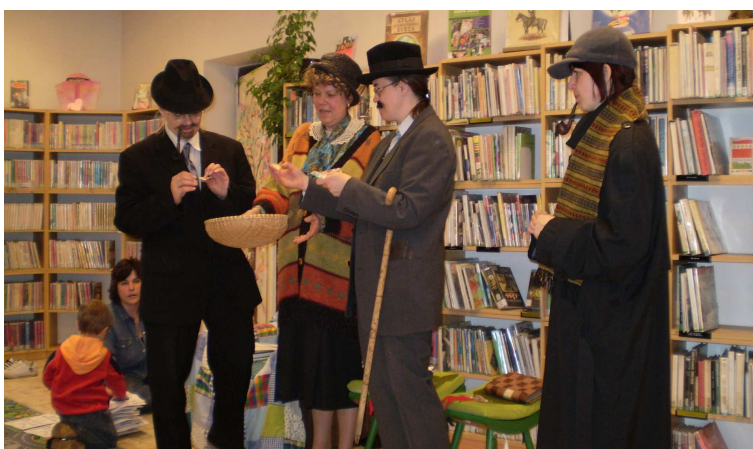
Slavnostní vyhlášení výsledků soutěže o nejlepšího literárního detektiva

Soutěž pro děti (i odrostlejší zájemce) Detektivní pátrání, aneb s internetem ke knize , kterou pořádala od března do začátku dubna 2008 Knihovna města Hradce Králové, byla ukončena slavnostním předáním cen. Setkání úspěšných pátračů se uskutečnilo v pátek 25.dubna v podvečer na pobočce v Kuklenách.