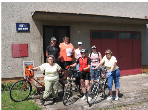
Účastníci cyklistického putování po knihovnách okresu 6.7.2008 před knihovnou v Osicích

Vzdělávání knihovníků bylo pestré, probíhalo celoročně a to různými formami: Zastavili jsme se s Čapky (26.2.2008), pěšky vyrazili na exkurzi po Hradci Králové (25.11.2008 - nové budovy Studijní a vědecké knihovny a Regiocentra Nový pivovar; nová pobočka KMHK na Eliščině nábřeží), na kolech objeli zajímavé knihovny okresu (6.7.2008), autobusem vyjeli do Památníku Karla Čapka v Dobříši (24.5.2008) a vlakem vyrazili do Jičína – města pohádek (12.9.2008). K poznávání a sebevzdělávání tak knihovníci využili všechny dostupné dopravní prostředky. V KMHK se knihovníci vzdělávali a setkávali na Aktivu knihovníků (29.4.2008), při Burze internetových zkušeností (1.4.2008) či na komponovaném pořadu Vánoční tajemství (9.12.2008).