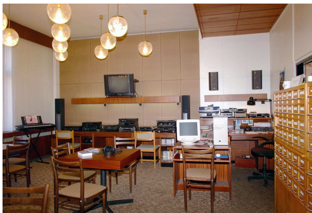
V poslechovém studiu hudební knihovny probíhají pravidelně pořady pro veřejnost

Klasické gramodesky je možno poslouchat přímo na místě spolu s tituly, které jsou vázány omezeními pro půjčování domů. Pro skupiny je možno dohodnout provedení hudebního pořadu na domluvené téma.