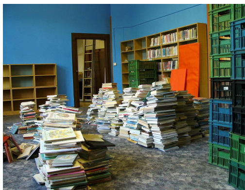
Pobočka Eliščině nábřeží během stěhování na podzim 2008

Dalším významným počinem bylo získání prostor bývalé studovny SVK HK na Eliščině nábřeží. Knihovna města Hradce Králové si část těchto prostor zadaptovala a zřídila zde půjčovnu pro děti a mládež.