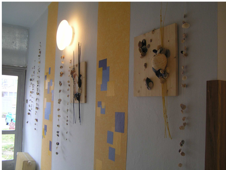
Nová podoba vstupních prostor pobočky Slezské Předměstí láká své čtenáře

V pobočce Slezské Předměstí proběhlo malování oddělení pro dospělé a bylo instalováno nové osvětlení. Ve spolupráci se Střední floristickou školou byla zrealizována výtvarná instalace v přístupových prostorách.