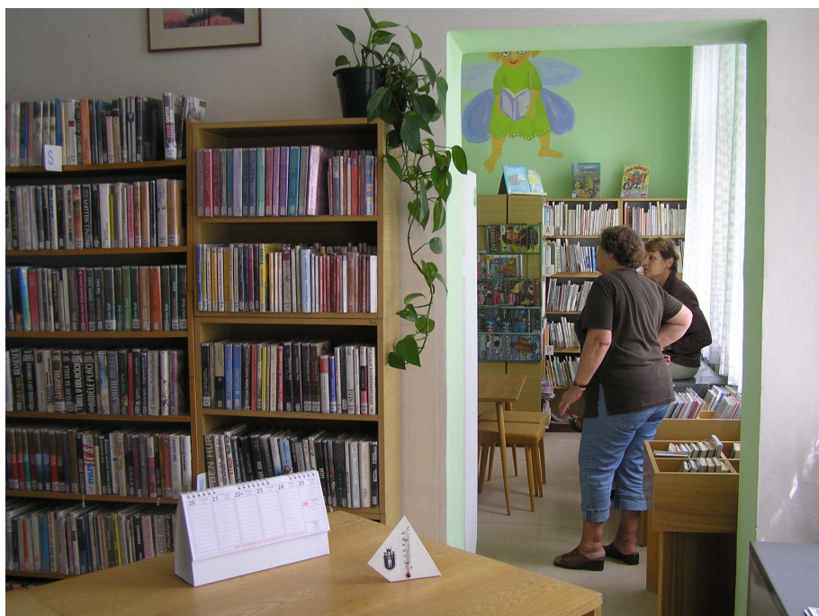
Interiér pobočky v Plačicích

Pobočka Plačice, která sídlí v objektu mateřské školky v Ořechové ulici byla v červenci 2009 vymalována a nově bylo uspořádáno oddělení pro děti a mládež.