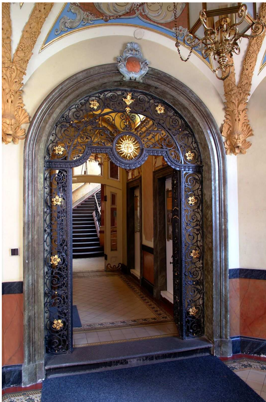
Vstupní chodba ústřední budovy Knihovny města Hradce Králové v Tomkově ulici čp. 177

Knihovna města Hradce Králové je tvořena kromě ústřední půjčovny s čítárnou a studovnou a specializovaných pracovišť (informační středisko, hudební knihovna, zvuková knihovna pro nevidomé) také třinácti pobočkami, které jsou rozmístěny na území města tak, aby byly služby knihovny dostupné všem jeho obyvatelům.