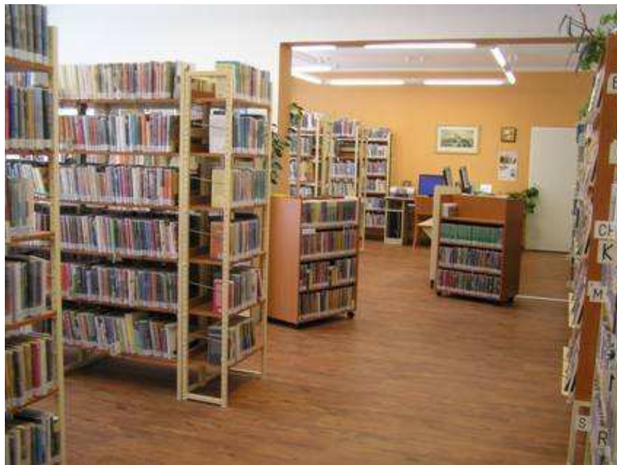
Půjčovna pro dospělé čtenáře na Slezském Předměstí po adaptaci v březnu 2009