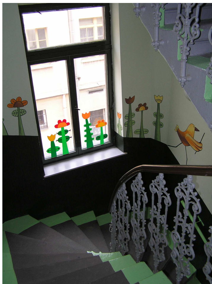
Upravené vstupní prostory v budově hudební knihovny