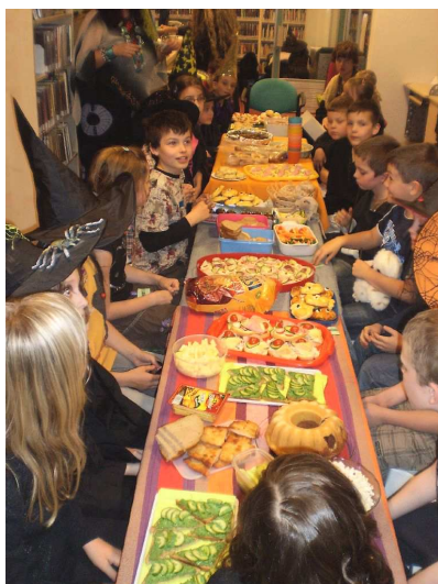
Magická noc v Kuklenách, 29. 4. 2011