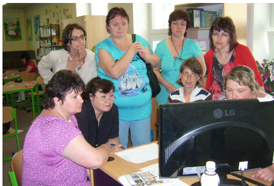
Základní knihovnický kurz pro neprofesionální knihovníky, praktický seminář konaný v Obecní knihovně v Předměřicích nad Labem 25. 5. 2011

Regionální služby v okrese jsou velmi vítané. Knihovny a jejich zřizovatelé regionální funkce využívají a hodnotí je kladně. Zejména cirkulaci výměnných fondů knihovníci považují za nenahraditelnou službu. Stále více se setkáváme s názorem, že na existenci regionálních funkcí je závislá existence malých knihoven jako takových.