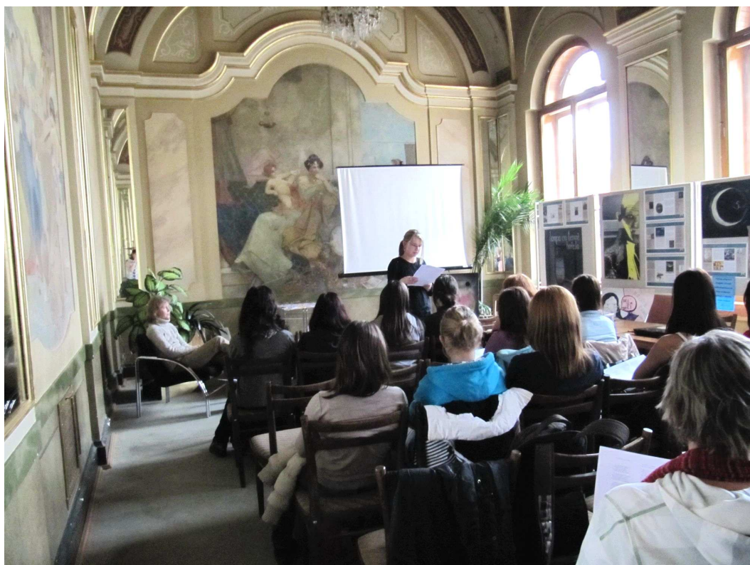
Pořad Chmury a naděje Karla Jaromíra Erbena pro střední školy

Největší návštěvnosti se těšila akce Hradec neznámý aneb po stopách knihy Starý Hradec Králové dům od domu , jejíž druhý ročník proběhl opět i v knihovně v Tomkově ulici 177. Vysoký počet návštěvníků byl na cestopisných promítáních. Veliký ohlas měl křest regionální knihy Létání a letiště v Hradci Králové . Jako každý rok, tak i letos jsme se zapojili do celostátního festivalu Dny poezie 2011, tentokrát s pořadem Chmury i naděje Karla Jaromíra Erbena . Jako každý rok jsme společně s Gymnáziem J. K. Tyla realizovali pořad ke dnům Frankofonie. Nově jsme navázali spolupráci s mezinárodní studentskou organizací AIESEC, která v prostorách knihovny pořádala zajímavé přednášky v cyklu besed nazvaném SEM a TAM . (Tato série má návštěvníkům přiblížit život v zahraničí.)