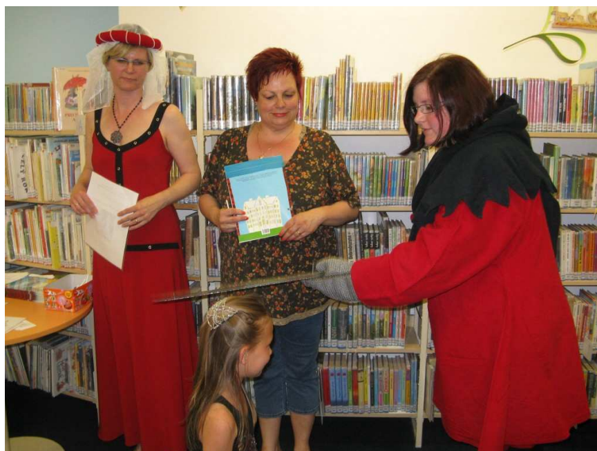
Pasování prvňáčků na čtenáře na pobočce Moravské Předměstí - B

V průběhu roku proběhlo na některých pobočkách KMHK slavnostní pasování prvňáčků na čtenáře (Kukleny, Moravské Předměstí - B, Nový HK) a předávání slabikářů (Moravské Předměstí - A, Labská).