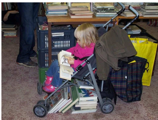
Knížní bazar 2011

V roce 2011 probíhala v návaznosti na budoucí stěhování knihovny aktualizace fondu, revize, opravy, balení a označování fondu elektromagnetickou ochranou. Uskutečnil se knižní bazar , na kterém se prodalo 30 000 knížek. Do souborného katalogu ČR přispěla knihovna více než 3 000 záznamy.